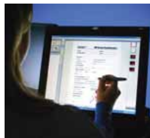
Neu! Schnelle Dateneingabe dank Stift-Tablet

Optionaler Tablet-PC zur Eingabe von Patientendaten in elektronischer Form